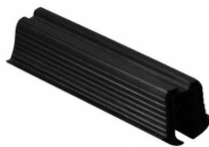
Gumové těsnění pro zábradlí s drážkou 24x24 mm