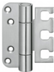
Simonswerk Variant VX 7728/100