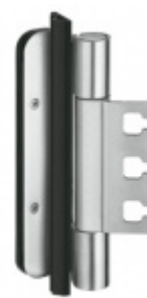
Simonswerk Variant VX 7939/160-4 FD VBRplus