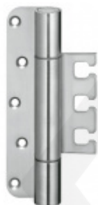
Simonswerk Variant VX 7728/160