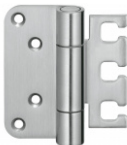
Simonswerk Variant VX 7729/100