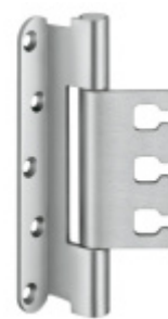
Simonswerk Variant VX 7939/160 Planum