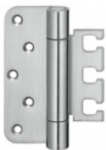
Simonswerk Variant VX 7729/120