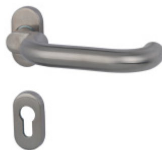
Klika s úzkou rozetou Súdmetall Paula III SP- R, 22 mm, TopSpeed, odsazená, 4.třída