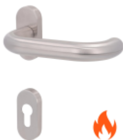
Klika s úzkou rozetou Súdmetall Paula III-R, 22 mm, TopSpeed, požární