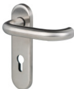
Štítkové kování Súdmetall Paula-KS, kl/kl, požární