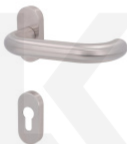
Klika s úzkou rozetou Súdmetall Paula III-R, 22 mm, TopSpeed