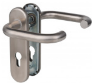
Štítkové kování Súdmetall Paula-KS