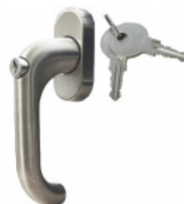
Uzamykatelná okenní klička Paula, nerez