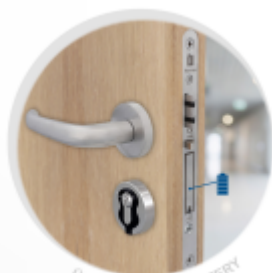
ÚLOCK NOVUS BATTERY