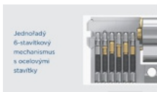
Jednořadý 6-stavítkový mechanismus s ocelovými stavítky