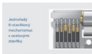
Jednoduchý 6-stavítkový mechanismus s ocelovými stavítky