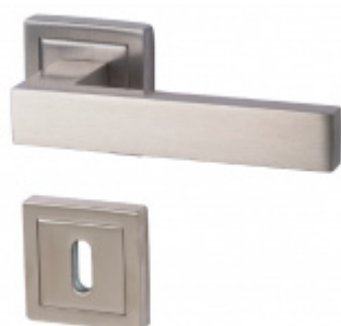
Südmetail Canto Square-R, nerez vzhled, TopSpeed