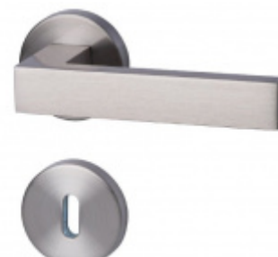
Südmetail Canto-R, nerez vzhled, 4. objektová třída