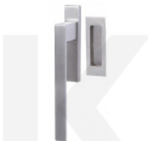
Okenní klika pro HS portály Südmetail Canto