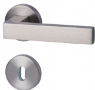
Südmetail Canto-R, nerez vzhled, TopSpeed