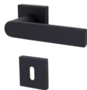
Súdmetall Korsika Quadro-R Black, TopSpeed