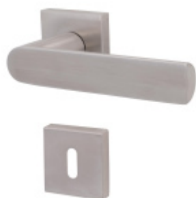
Súdmetall Korsika Quadro-R, TopSpeed