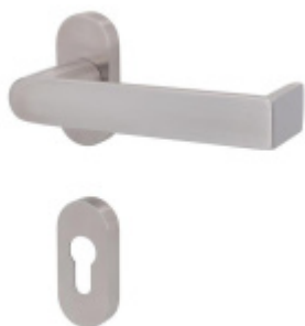
Klika s úzkou rozetou Súdmetall Korsika II-R, paniková