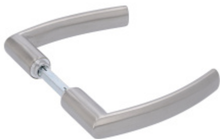
Klika ke kování pro skleněné dveře Südmetall Katy