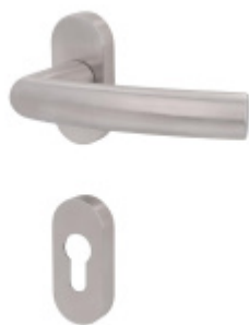
Klika s úzkou rozetou Südmetall Katy II-R