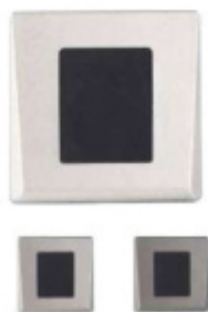
ÜControl RFID - čtečka, bateriová