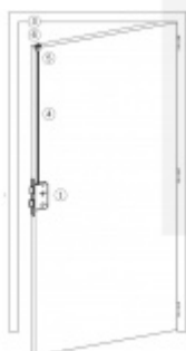
Stranové určení zámků SSF