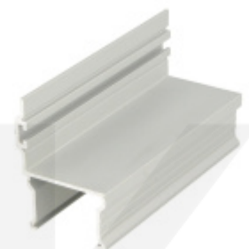
Zárubňový profil, hliník