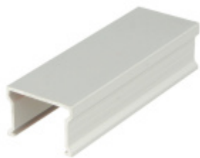
Ukončovací profil, hliník