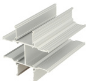
Spojovací křížový profil, hliník