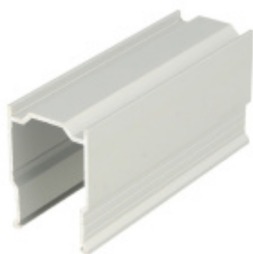
Kotvící profil ke zdi, hliník