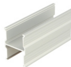
Spojovací profil, hliník