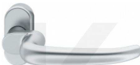
FSB 06 1023 odsazená klika, úzká rozeta