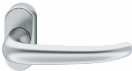
FSB 09 1023, klika na úzké rozetě