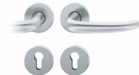
Kování FSB 12 1023 ASL