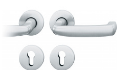
Kování FSB 12 1159 ASL