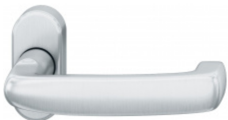
FSB 09 1159, klika na úzké rozetě