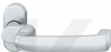
FSB 06 1159 odsazená klika, úzká rozeta