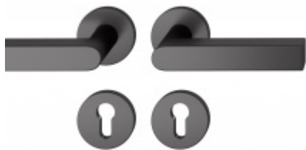
Kování FSB 12 1001 ASL