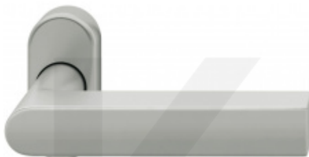
FSB 09 1001, klika na úzké rozetě