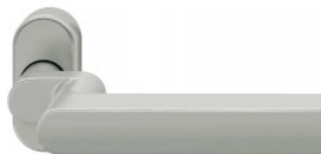
FSB 06 1001 odsazená klika, úzká rozeta

OD 59,49 € Termín bude prověřen u dodavatele