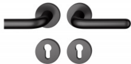
Kování FSB 12 1147 ASL