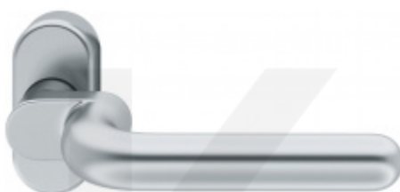
FSB 06 1147 odsazená klika, úzká rozeta

OD OD 993 Kč Termín bude prověřen u dodavatele