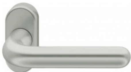
FSB 09 1147, klika na úzké rozetě