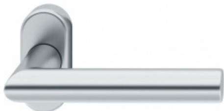
FSB 09 1076 klika na úzké rozetě