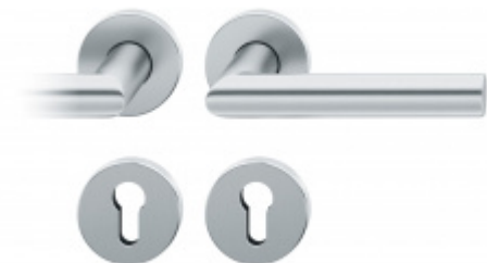
Kování FSB 12 1076 ASL