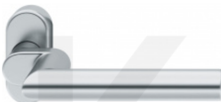
FSB 06 1076 odsazená klika, úzká rozeta

OD OD 1 095 Kč Termín bude prověřen u dodavatele